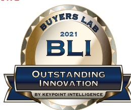
Xerox Adaptive CMYK+ Kits

Poussez l'automatisation jusqu'au bout avec une qualité couleur automatisée en quelques clics, et un ensemble d'outils atériels et logiciels de gestion des couleurs. La combinaison unique du spectrophotomètre X-Rite® en ligne avec la suite Color Profiler et la suite ACQS (Automated Color Quality Suite) élimine la variabilité chromatique, réduit les opérations manuelles chronophages sur les couleurs et les erreurs humaines.